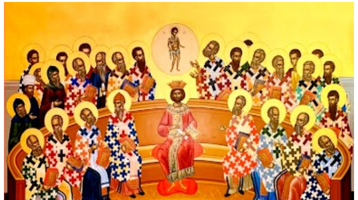
Ikonos, vaizduojančios Nikėjos susirinkimą, fragmentas.

Tarp krikščionių kildavo nesutarimų, kartais peraugančių į rimtus konfliktus ir ginčus dėl įvairių su tikėjimu susijusių klausimų. Nikėjoje patvirtintas bendras Tikėjimo išpažini-